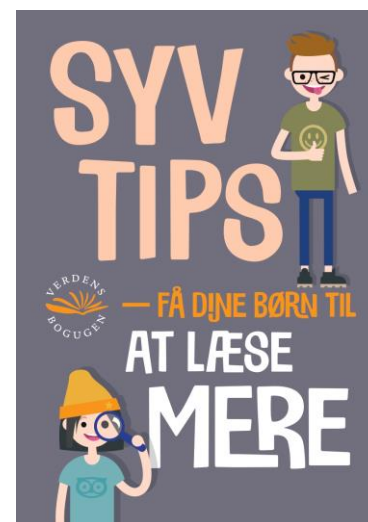
Folder til uddeling