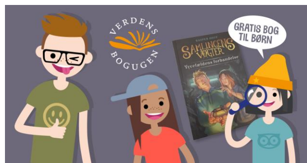
Syv grafikker til SoMe & e-mails (Tilrettet med nye datoer)