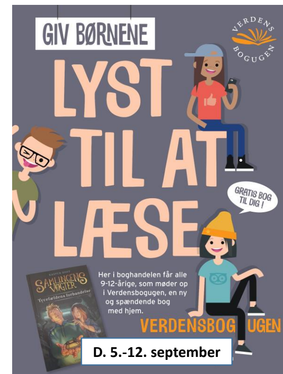
Plakater og skilte (& labels til at rette datoerne)